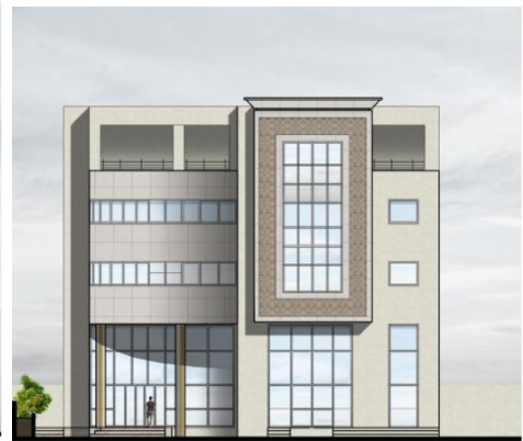
Facade sur Rue

Les plans de situation sont disponibles sur le site www.gammarth-immobiliere.tn , ou directement chez Gammarth Immobilière.